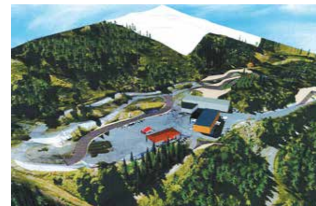
Vue 3D du plan d'aménagement

Mais le dynamisme économique de Chamrousse passe également par la diversification de la clientèle grâce au développement des activités touristiques et de loisirs sur les quatre saisons. Une évolution qui s'appuie d'une part sur les atouts spécifiques de Chamrousse – montagne saine et sportive, montagne de proximité – mais aussi sur la création sur le territoire de la commune d'équipements attractifs tel qu'un centre de loisirs aquatique lié au bien-être et à la vie saine et la réalisation d'hôtels et de résidences de séjour. Enfin l'objectif des élus est de compléter le modèle économique en confortant le commerce de proximité, en favorisant l'implantation d'activités et d'emplois non délocalisables à l'année, notamment en créant une zone d'activité artisanale sur le secteur du Schuss des dames ainsi qu'un espace dédié au « coworking » au cœur de Recoïn.