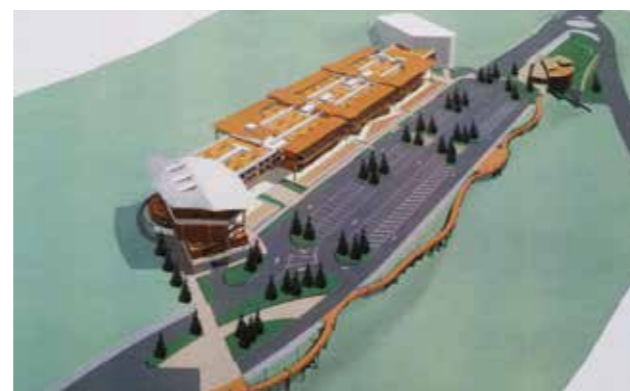
Réhabilitation du bâtiment du centre commercial et de ses abords

De même, et afin de favoriser les déplacements « doux »