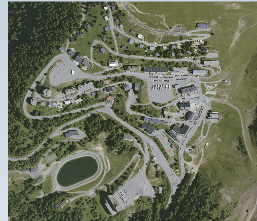
Plan de masse de Recoïn : aujourd'hui ↑ aboutissement du projet, 2030 ↓

De même, la commission a souligné les principaux atouts du projet; respect du paysage, attention portée aux cheminements piétons et à l'insertion des stationnements, écriture architecturale propre à inscrire la station dans l'avenir et bilan positif en matière de consommation foncière des zones naturelles (gain de 2 653 m 2 entre les surfaces à urbaniser restituées et les zones naturelles consommées qui restent marginales). Ce Comité de Massif des Alpes est une instance officielle conduite par le Préfet de Massif des Alpes, regroupant les acteurs de l'Etat, des Collectivités, du monde économique et associatif liés au développement et à la protection de la Montagne. ▶