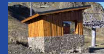
Cabane des Roberts Nouvelle cabane des Gaboureaux

Depuis sa création, en 2007, la Régie Remontées Mécaniques Chamrousse s'est efforcée, dans toutes ses réalisations, d'intégrer les gares de départ et d'arrivée dans le paysage et l'environnement. Cette intégration donne une nouvelle identité à la station, comme il est possible de le constater avec la gare avale de la télécabine, la nouvelle cabane des Gaboureaux (mutualisation avec l'ESF et le club des sports). Les nouveaux aménagements sur le front de neige donnent une image plus contemporaine du domaine skiable. ▶