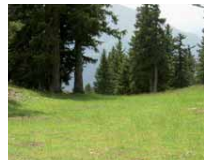
Ré-engazonnement piste Eterlou